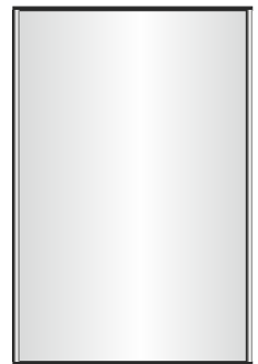
art. convexa15x5 20x30cm

Targhette con struttura in alluminio MODELLO CONVESSA