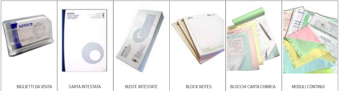
BIGLIETTI DA VISITA